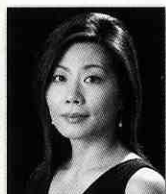
坂本朱 (メゾソプラノ)